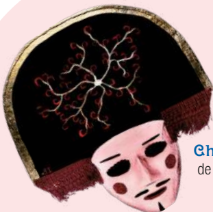
Chocalleiro de Vilardevós.

A partir das 20.00 h: Fariña, fulións e actuación da charanga Alegría .