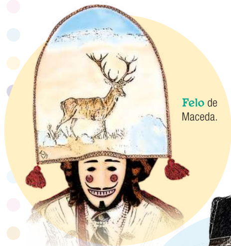
Felo de Maceda.

11,30 h: Gran DESFILE infantil polas principais rúas da villa. 22,00 h: Festa Brilli Brilli Glam Remember Party na Praza de San Roque coa actuación estelar de Leticia Sabater e DJs recoñecidos (temática dos oitenta y brillante). 21,00 a 01,00 h: Charangas Louband e Bandiños Band .