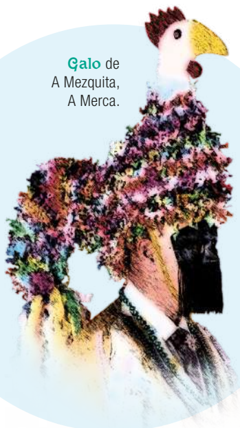
Galo de A Mezquita, A Merca.

11.00 h: DESFILE de Entroido en Covelo. Subida o Coto da Raña coa comitiva: O Rei, soldados, danzantes, xuíces, porteiro, bobo... Pola tarde festa con Os Veternos .