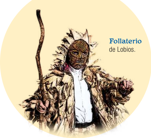
Follaterio de Lobios.

Saída da Misa, saúdo dos Peliqueiros e Reparto da Bica na Praza da Picota.