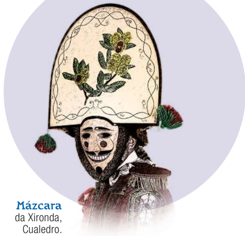
Mázcara da Xironda, Cualedro.

23.59 h: Baile coa orquestra Olympus na Rúa do Progreso.