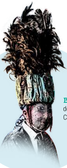
Bonitas de Sande, Cartelle.