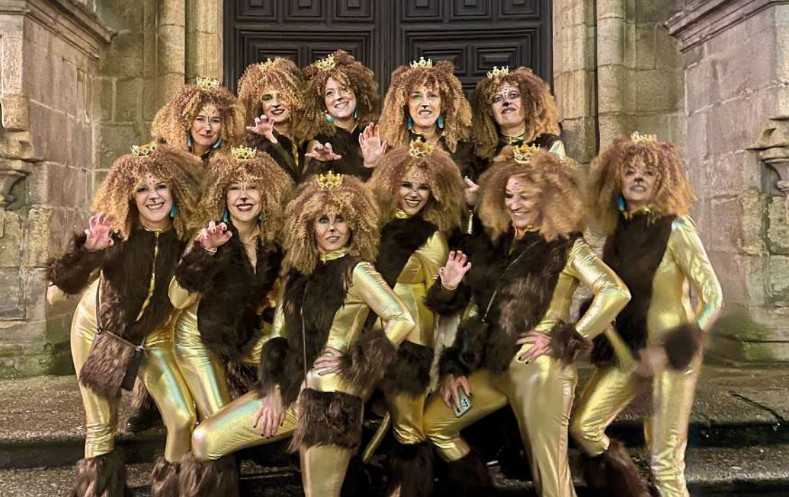
Festa de Comadres na cidade de Ourense.