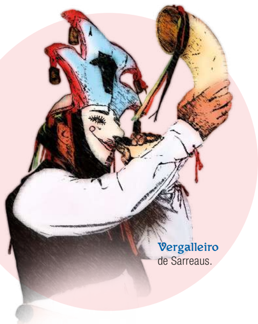
Vergalleiro de Sarreaus.