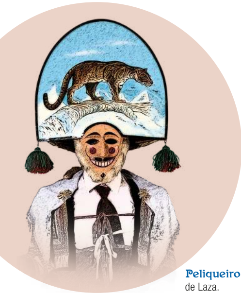
Peliqueiro de Laza.