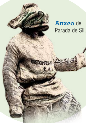
Ánxeo de Parada de Sil.

Pola mañá cedo, Estrea dos Peliqueiros . Pasarrúas mañá e tarde coas charangas Os Komanolas e Europa .