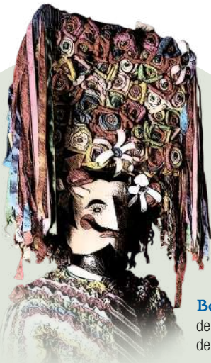
Boteiro de Vilariño de Conso.

20.00 h: Rodos en Pazos de Arenteiro. Ao remate pinchos e chocolate.