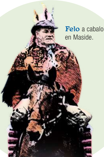
Felo a caballo en Maside.

00,00 h: Descenso da comitiva polo camiño real, encabezada por Don Carnal.