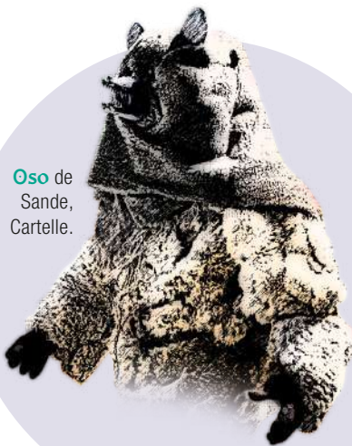
Oso de Sande, Cartelle.

24,00 h: Gran subasta e, a continuación, queima do Entroido e Festa rachada.