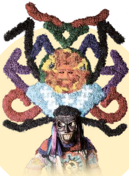
Boteiro de Viana do Bolo.