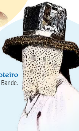
Troteiro de Bande.