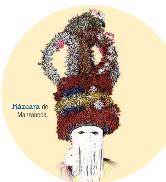
Mázcara de Manzaneda.